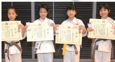
小学3、4年生女子組手