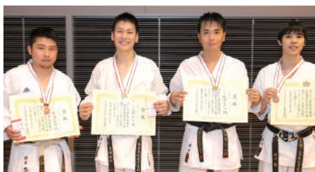
一般男子有段組手