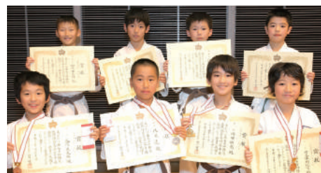
小学4年生男子組手