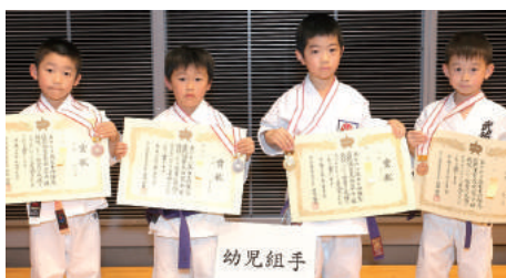
幼児組手 幼児組手