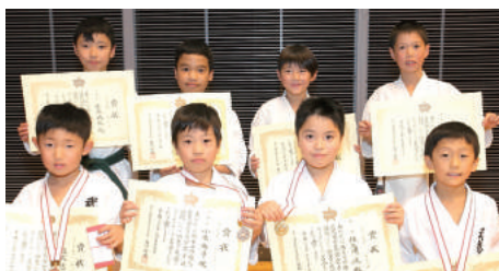
小学3年生男子組手