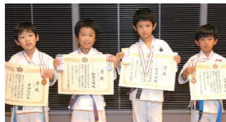
小学1年生男子組手