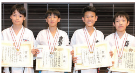
小学6年生男子組手