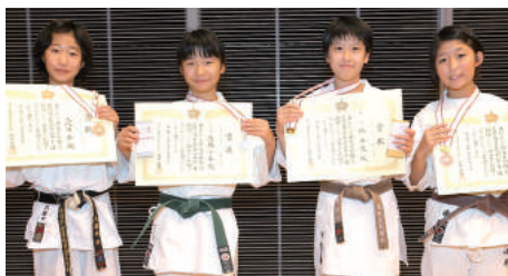
小学5、6年生女子組手