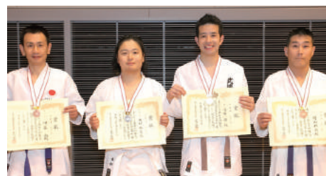
一般男子有級組手