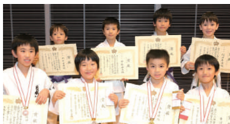
小学2年生男子組手