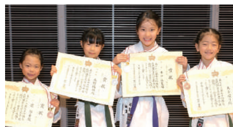
小学1、2年生女子組手