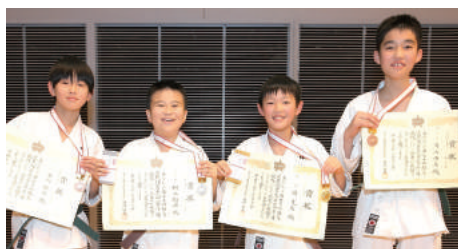
小学5年生男子組手